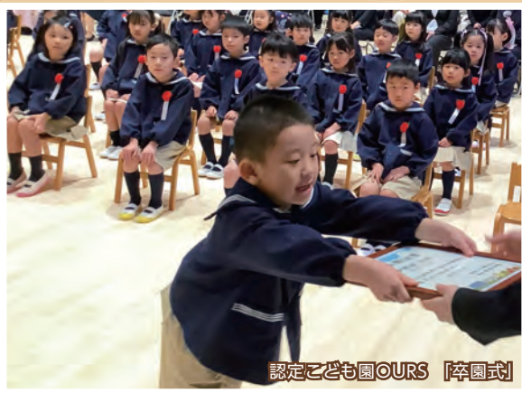
認定こども園OURS [卒園式]