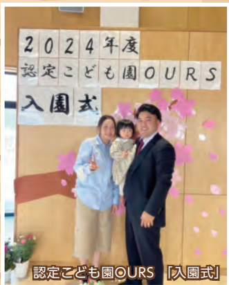
認定こども園OURS [入園式]