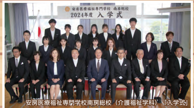
安房医療福祉専門学校南房総校(介護福祉学科) [入学式]