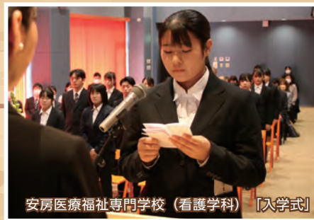
安房医療福祉専門学校(看護学科) [入学式]