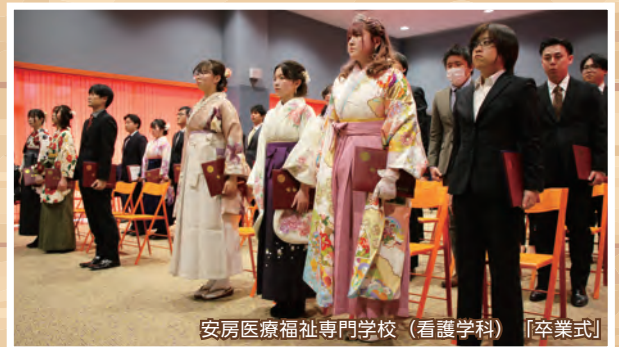
安房医療福祉専門学校(看護学科) [卒業式]