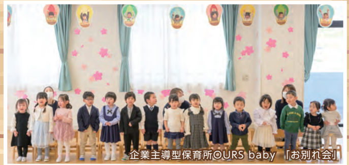
企業主導型保育所OURS baby [お別れ会]