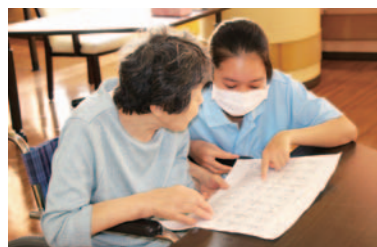
太陽会でのアルバイトも