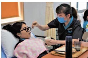
専門学校での授業

通常の授業は毎日9時～14時30分まであり、2年間で57日間の介護現場実習にも行きました。中には日本人でも難しい講義もあり、それを日本語で学んできました。科目ごとに試験もあります。