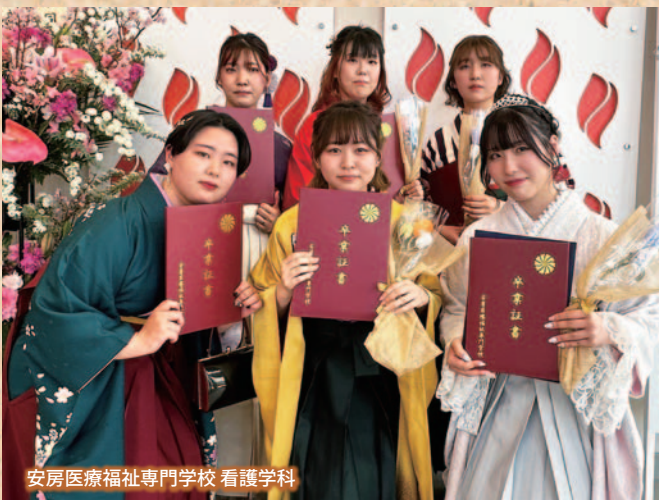
安房医療福祉専門学校 看護学科