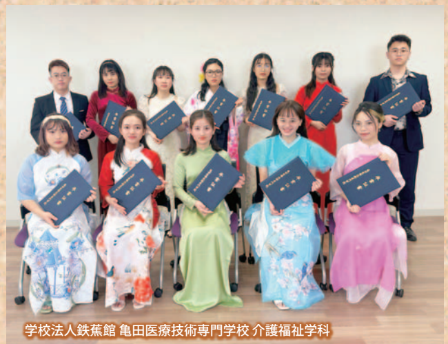
学校法人鉄蕉館 亀田医療技術専門学校 介護福祉学科

▲認定こども園OURS 卒園式、安房医療福祉専門学校 卒業式、亀田医療技術専門学校 介護福祉学科 卒業式