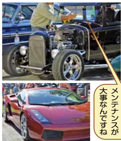
人間も車もメンテナンスが大事なんです

「もう歳だからしょうがない」と諦めていた事は、実はフレイルかもしれません。一方でフレイルの段階であれば、適切なケアによって改善できる可能性があります。年齢のせいと安易に考えていた事にしっかりと目を向けて、食事や運動について少しずつ見直してみましょ。