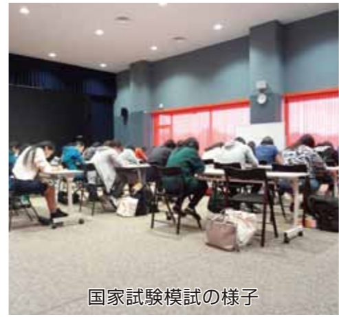
国家試験模試の様子

《お問い合わせ》 安房医療福祉専門学校 ☎ 0470 (28) 5100 E-Mail awa.office@awa-school.ac.jp http://www.awa-school.ac.jp