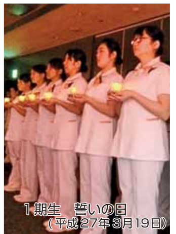
1期生 誓いの日 (平成27年3月19日)

2年次のハワイ研修、3年次の実習期間を経て国家試験受験資格を取得した1期生。 キャンダルを受け取り宣誓した誓いの日から早2年。いよいよ1期生が看護師として羽ばたく春を迎えることになった。 また、2期生・3期生も1期生を手本とし日々の授業や実習を通して、有意義な時間を過ごしている。