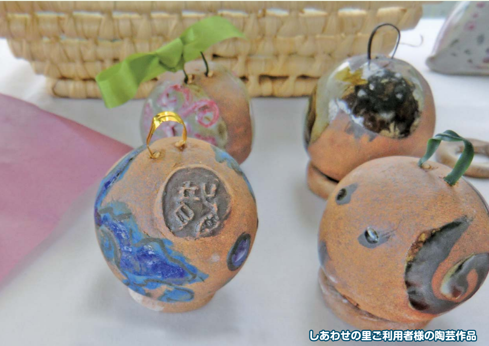
しあわせの里ご利用者様の陶芸作品