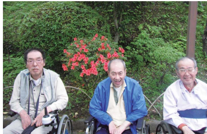
梅雨入りし、本格的な夏の到来を間近に感じられる6月中旬、館