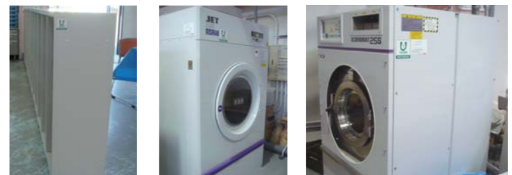
〈スチール棚〉 〈ガス式乾燥機〉 〈全自動洗濯脱水機〉