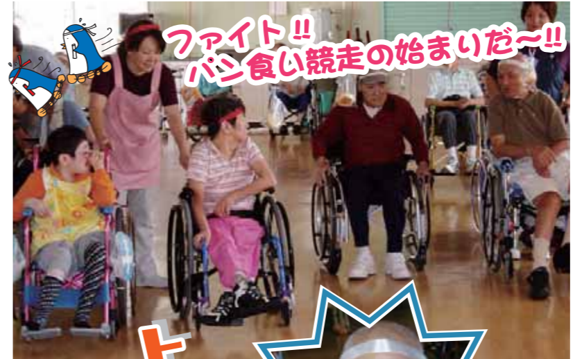
ファイト!! パン食い競争の始まりだ~!!

普段は和やかな雰囲気のご利用者もこの日はやはりアスリートの顔つきに。互いに応援しながらスピードを競っていた。ゴールした後は餡子たつぷりのあんパンを互いの健闘を讃え合いながらおいしそうに頬張っていた。 続いて行われた職員による飴食い競争。粉の中に顔を勢い良く顔を突っ込んで顔中粉だらけにしながら飴を拾い出す。中にはその職員の顔を押し付けてさらに真っ白にしている