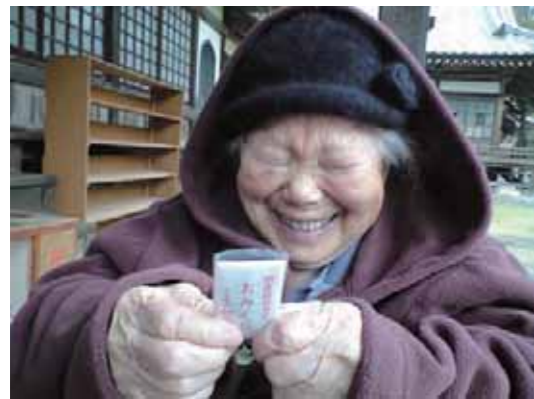
☆ヒント☆ 日露戦争勃発の年生まれです。

人間国宝級 11月吉日。めでたく誕生日を迎えられたご利用者。 この肌のハリ いくつに見えますか？