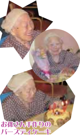
お孫さん手作りのパースティックケーキ

いつでも笑顔で好き嫌いなく何でも食べて何事にも感謝の気持ちをお忘れずに穏やかに過ごす事が健康の秘訣なのかなと思う。