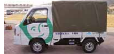
日本財団福祉車両助成事業らんまん授産事業用