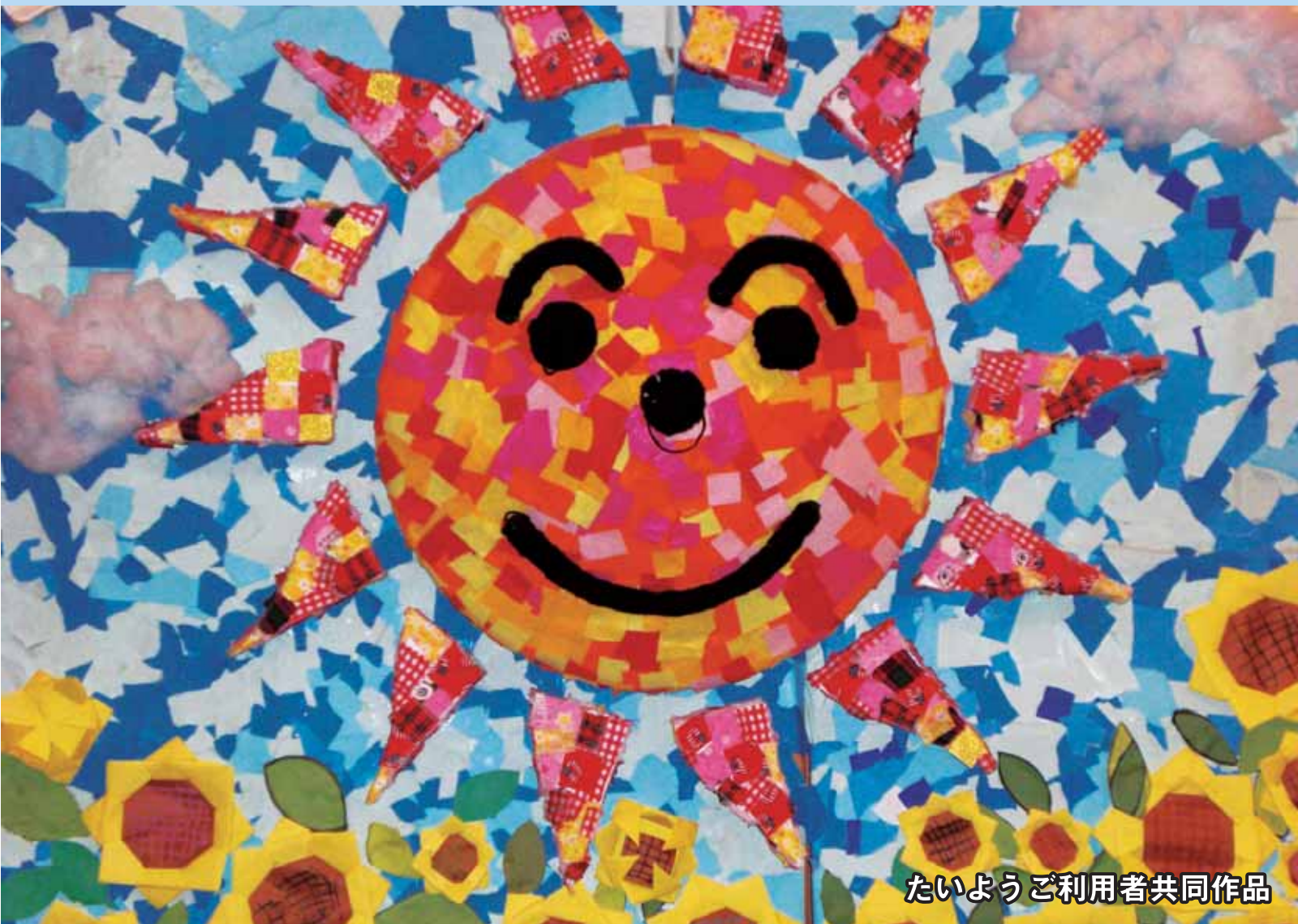
たいようご利用者共同作品

〒296-0124 千葉県鴨川市大幡1222-1 TEL 04(7098)1000 FAX 04(7098)1002