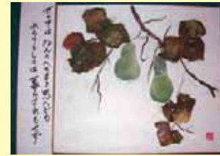
たいよう ご利用者