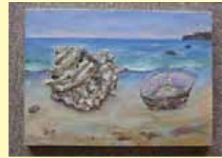
まんぼう ご利用者

今回、表紙のデザインは『夏』をテーマに、ご利用者の作品を掲載させて頂くことに致しました。どの作品もそれぞれがイメージする『夏』を力強く繊細に表現しており、表紙1枚だけを選ぶにはおいしい作品ばかりでした。全作品を『“サン・サン”美術展』と題して出展させて頂きます。ご協力、誠にありがとうございました。