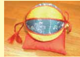
たいよう ご利用者