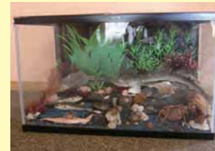
まんぼう ご利用者