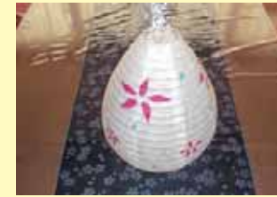
たいよう ご利用者