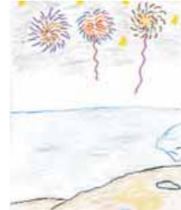
らんまんご利用者