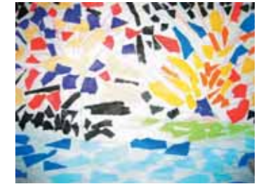
らんまんご利用者