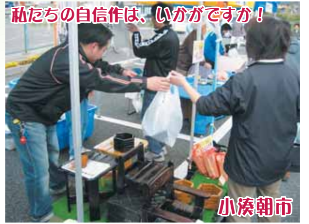
私たちの自信作は、いかがですか! 小湊朝市