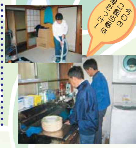
お食事の準備は90分

工賃アップに(皆、一ヤリ!)。また各種イベントのデーターを取り、お客様のニーズにあった各種製品の開発、販売戦略等も研究する程で今や商売人も顔負け。その他にも東北のイベントや地域に密着した販売も以前同様に行なっていますので皆様もぜひ一度足を運び、イベントの盛況ぶりをご覧になってはいかがでしょうか? 笑顔でお待ちしております。