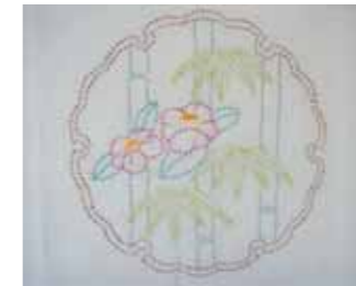
めぐみの里ご利用者