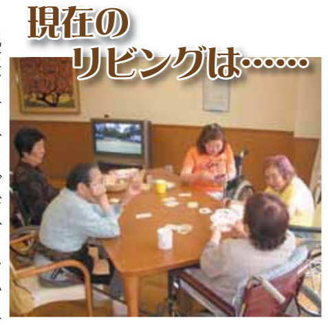
現在のリビングは.....

平成17年6月から行われた既存の一部改修工事は、平成19年3月に完了した。リビングを新たに9箇所増設し、各リビングにてご利用者は、様々な生活を過ごされている。新たな環境に変化したことで、ご利用者の生活や様子は、少しずつだが変化し始めてきた。