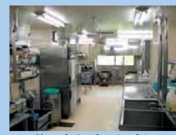
天井・床もピッカピカ☆

千葉県の老人福祉施設修繕事業の補助金により、厨房の改修工事を行いました。 明るく、清潔になった厨房で、より一層充実した食事の提供に努めてまいります。