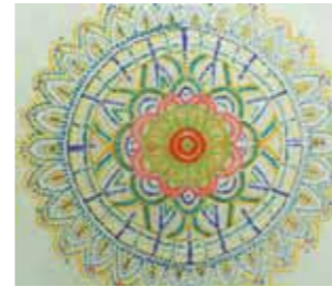
たいようご利用者