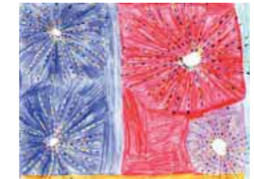
らんまんご利用者

今回、表紙のデザインは「夏」をテーマにご利用者の方々に描いて頂くことに致しました。 描いて頂いたどの作品も季節をよく捉え、力強く描かれた作品だった為、表紙1枚だけを選ぶにはおしい作品でしたので、背表紙ではありますが、全作品を掲載させて頂くことに致しました。