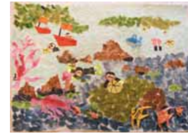
めぐみの里ご利用者