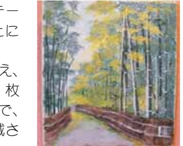
たいようご利用者