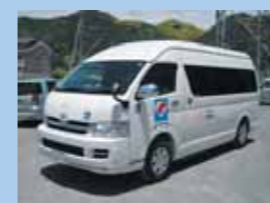
千葉県共同募金より