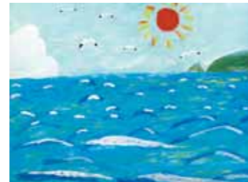
しあわせの里ご利用者